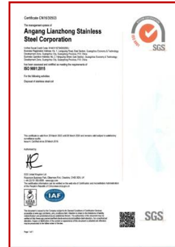
ISO 9001 (冷轧光亮厂)